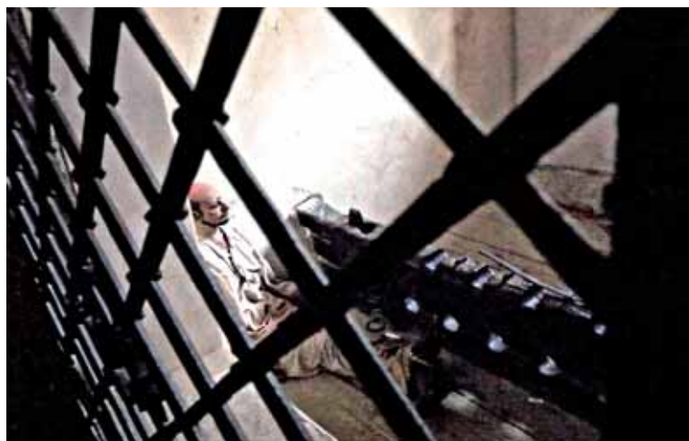
• Neposlušní poddaní to nemali jednoduché a často končili v klade.