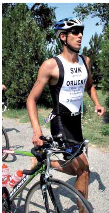
● Z vody treba vyjsť čo najskôr a sadnúť na bicykel.