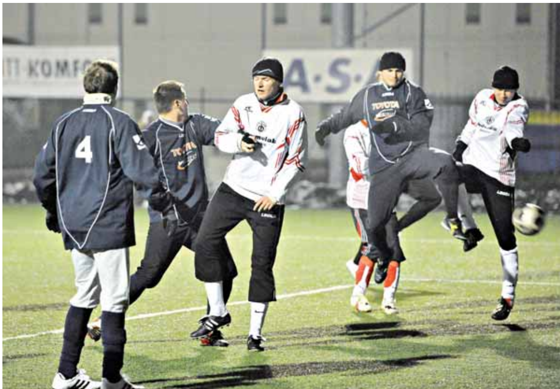
● Momentka zo súboja Hrnčiaroviec so Smolenicami.