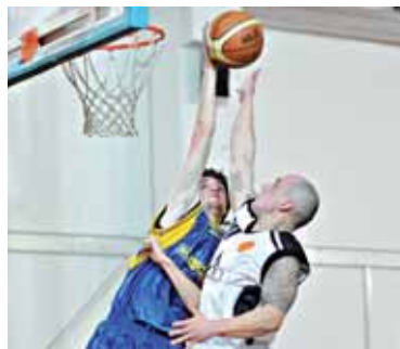
● Muži sa stále trápia.

Trnava sa predstaví doma aj v ďalších troch zápasoch. V dohrávanom 1. kole (30.1.) privíta Slávia Štadión Trenčín, v 4. kole (13.2.) ŽOS Zvolen a v 5. kole (14.2.) MŠK Žiar nad Hronom. Trnave