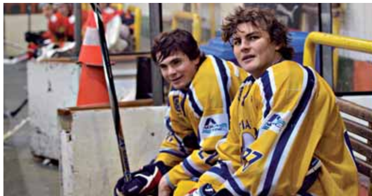
● Juniore sa môžu zatiaľ na striedačke poriadne vyškierať.