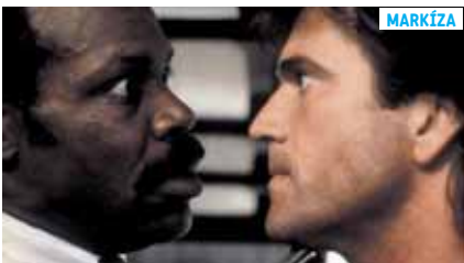
20.00 Smrtonosná zbraň