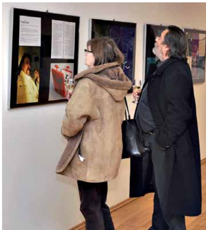
● Ojedinelá exkluzívna výstava významného svetového dizajnéra zavítala do Piešťan.

Aj po svojej osemdesiatke zostáva Colani svojším, dynamickým a vo