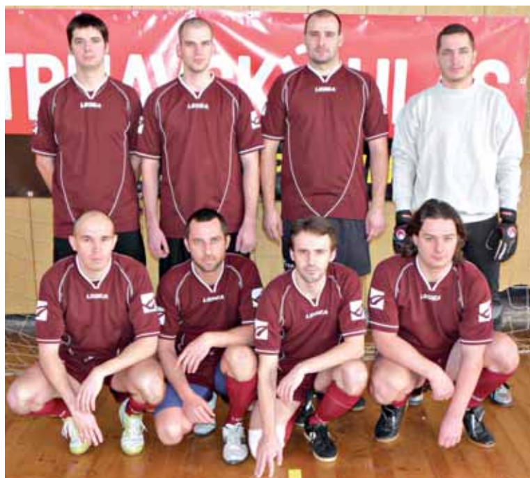
● Benfica Trnava je na 13. mieste tabuľky.