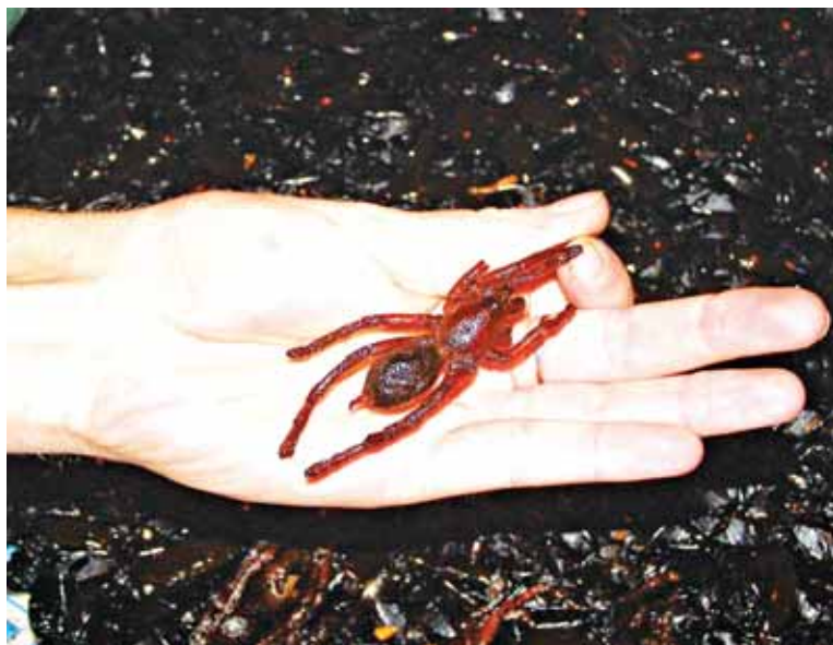
● Dobrú chuť. No nekúpte to!

že to tam vôbec takto nevnímala. „Deti reagovali na liečbu veľmi rýchlo. Ožili, pribrali, veselo sa hrali s kamarátmi a chodili do školy. Takže ja som ich väčšinou videla usmiate. Aj keď... Niekedy mali napriek liečbe zlé dni. Vtedy iba ležali a plakali. A dve detičky nám umreli. Prišli príliš neskoro, liečba už u nich nezabrala.“