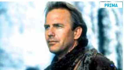
20.00 Posol budúcnosti