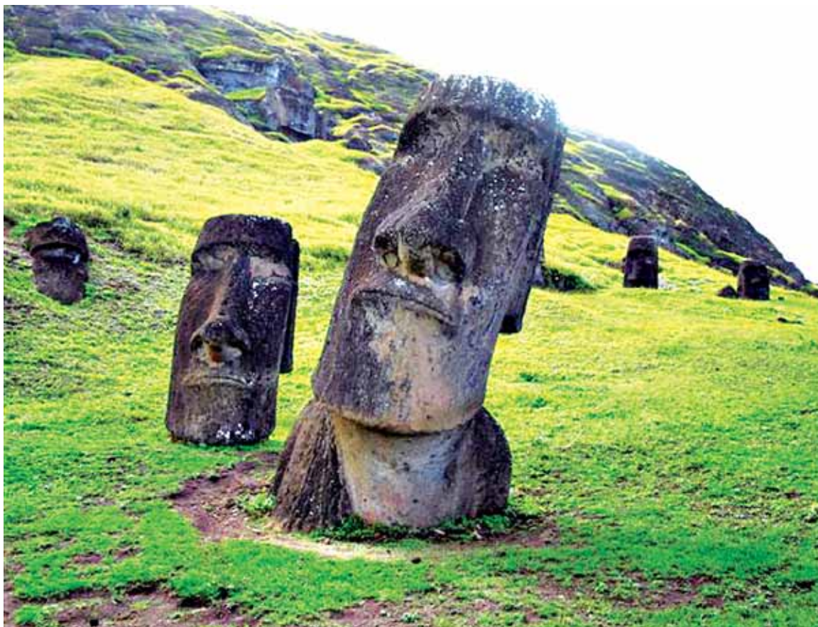
● Veľkonočný ostrov. Vidieť ho je naozaj jedinečný zážitok.