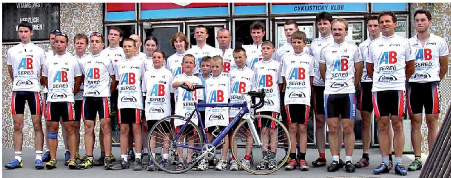
● Úspešný cyklistický klub AB Sered, ktorý pôsobí pri firme bratov Tomčányiovcov.