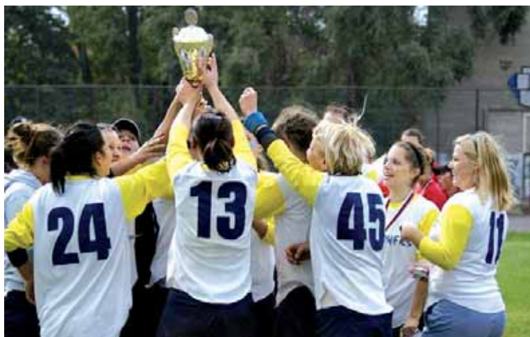
● Takto oslavovali titul...