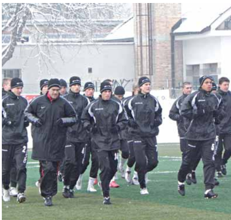
● Spartakovci zaberajú v Piešťanoch.

To už tím čakal povinný odpočinok a popoludní ďalšia zberačka. Kondičný pobyt Malatinského družina zakončí v piatok tréningovú jednotkou a spoločným obedom.