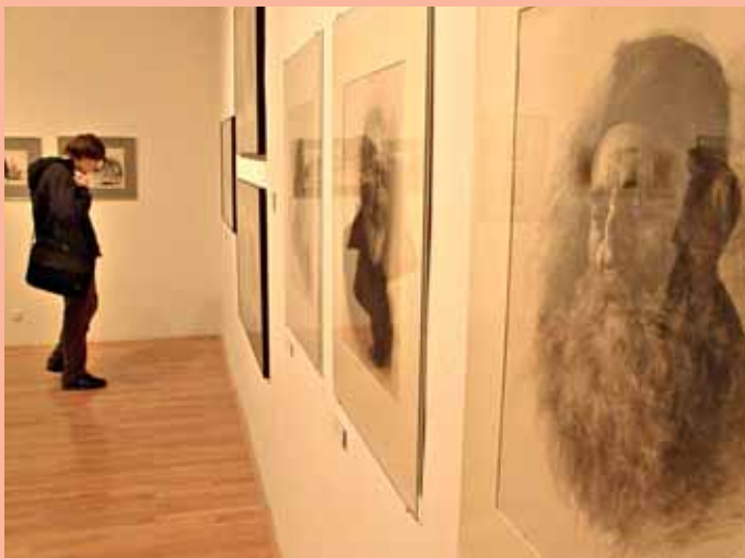
● Kresby, grafiky, lepty a iné tradičné postupy významných autorov vystavuje galéria po prvý raz.

TRNAVA – Zbierkotvornú činnosť Galérie Jána Koniarka v Trnave prezentuje výstava Plavba línií, ktorej vernisáž sa uskutočnila vo štvrtok 14. januára.