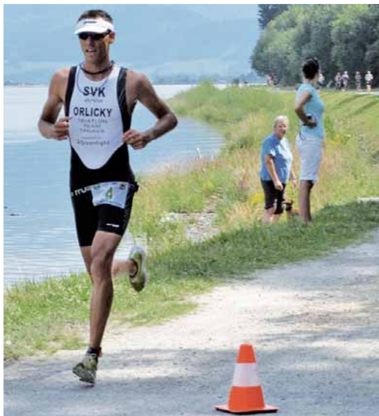
● Po bežeckej časti čaká na pretekára vytúžený cieľ.