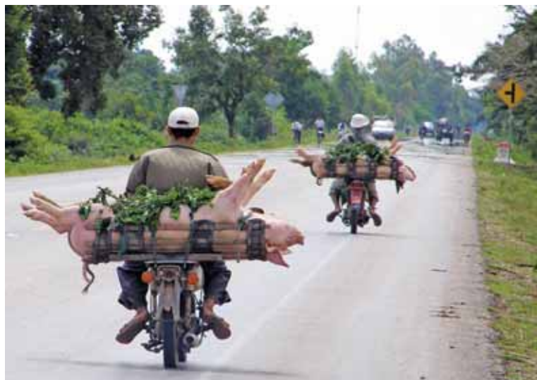
● Na cestách vidno všetko, módu, rôzny tovar a aj to, čo bude na večeru.