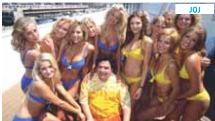
20.00 Pinou parou vzad!

05:00 Jak se věci mají 01 05:30 Jak se věci mají 02 06:00 Geologické pouť 02 07:00 Znovuoobjevitelé 33 07:30 Znovuoobjevitelé 34 08:00 Zvířecí rekordmani 14 09:00 Mistrů švindlu 31 09:35 Mistrů švindlu 32 10:15 Bud' já nebo pes 43 11:10 Skryté možnosti 29 11:40 Skryté možnosti 30 12:10 Jamieho Amerika 03 13:10 Kamenné monumenty 19 13:40 Města ve výškách 09 14:15 Za sportem kolem světa 07 15:10 Zvířecí rekordmani 17 16:10 Mistrů švindlu 33 16:45 Mistrů švindlu 34 17:20 Jak se věci mají 03 17:50 Jak se věci mají 04 18:20 Zvířecí rekordmani 34 19:20 Životospráva na chalupě 03 20:20 Tělo v číslech 02 21:15 Boj o život 02 22:15 Geologická pouť 02 23:20 Budoucnost vody 02 00:25 Králové a královny 07 00:55 Antické olympijské hry 07 01:25 Historie podsvětí 06 02:20 Místa ve Středomoří 04 03:25 Dunaj 03:55 Místa ve Středomoří 21