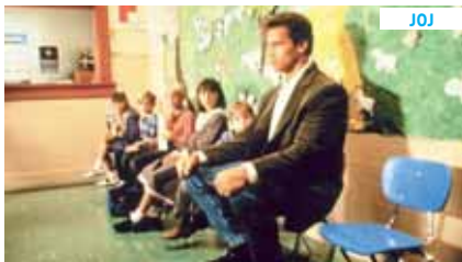
21.00 Policajť z škôlky

05:00 Pokusní králici 07 05:25 Pokusní králici 08 06:00 On the Spot 03 - Reportáže 07:00 Znovuobjevené 29 07:30 Znovuobjevené 30 08:00 Zvířecí rekordmani 32 09:00 Mistrři švindlu 27 09:35 Mistrři švindlu 28 10:10 Bud' já nebo pes 41 11:10 Skryté možnosti 25 11:40 Skryté možnosti 26 12:10 Jamieho Amerika 01 13:10 Kamenné monumenty 17 13:40 Města ve výškách 07 14:15 Za sportem kolem světa 05 15:10 Zvířecí rekordmani 15 16:10 Mistrři švindlu 29 16:45 Mistrři švindlu 30 17:20 Mistrři švindlu 18 18:25 Zvířecí rekordmani 32 19:20 Životospráva na chalupě 01 20:20 Ztracené dětství 21 21:15 Smrtící plavba 22:10 Meze poznání 23 23:15 Úsvit lidstva 02 00:20 Králové a královny 05 00:50 Antické olympijské hry 05 01:20 Historie podsvětí 05 02:15 Mista ve Středomoří 02 03:20 Dunaj 03:50 Mista ve Středomoří 19 04:55 Mistrři švindlu