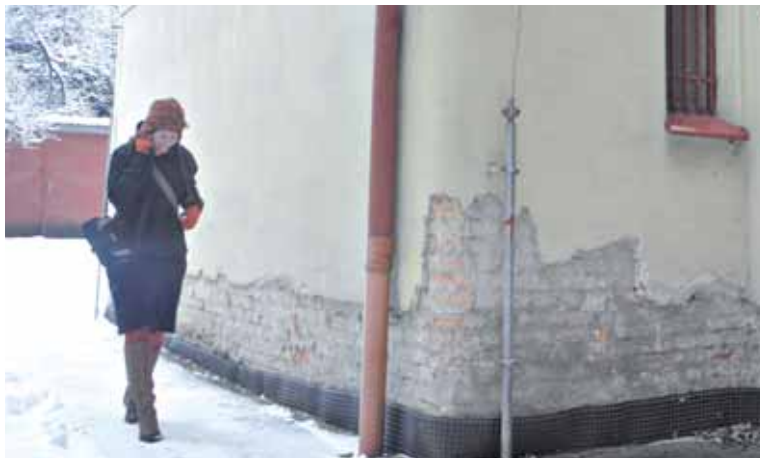
● Rekonštrukciu by potrebovala hlavne fasáda knižnice.

Podľa slov hovorkyne dnes kraj čaká na výzvy z eurofondov v oblasti kultúry. V prípade, že by ich žiadost' schválili, budú opäť hľadať nové priestory. Nová budova by mala ľuďom poskytnúť moderné knižnično-informačné služby, zabezpečiť fond pred krádežami a poškodením. Jej umiestnenie plánuje TTSK v centre mesta. kvet