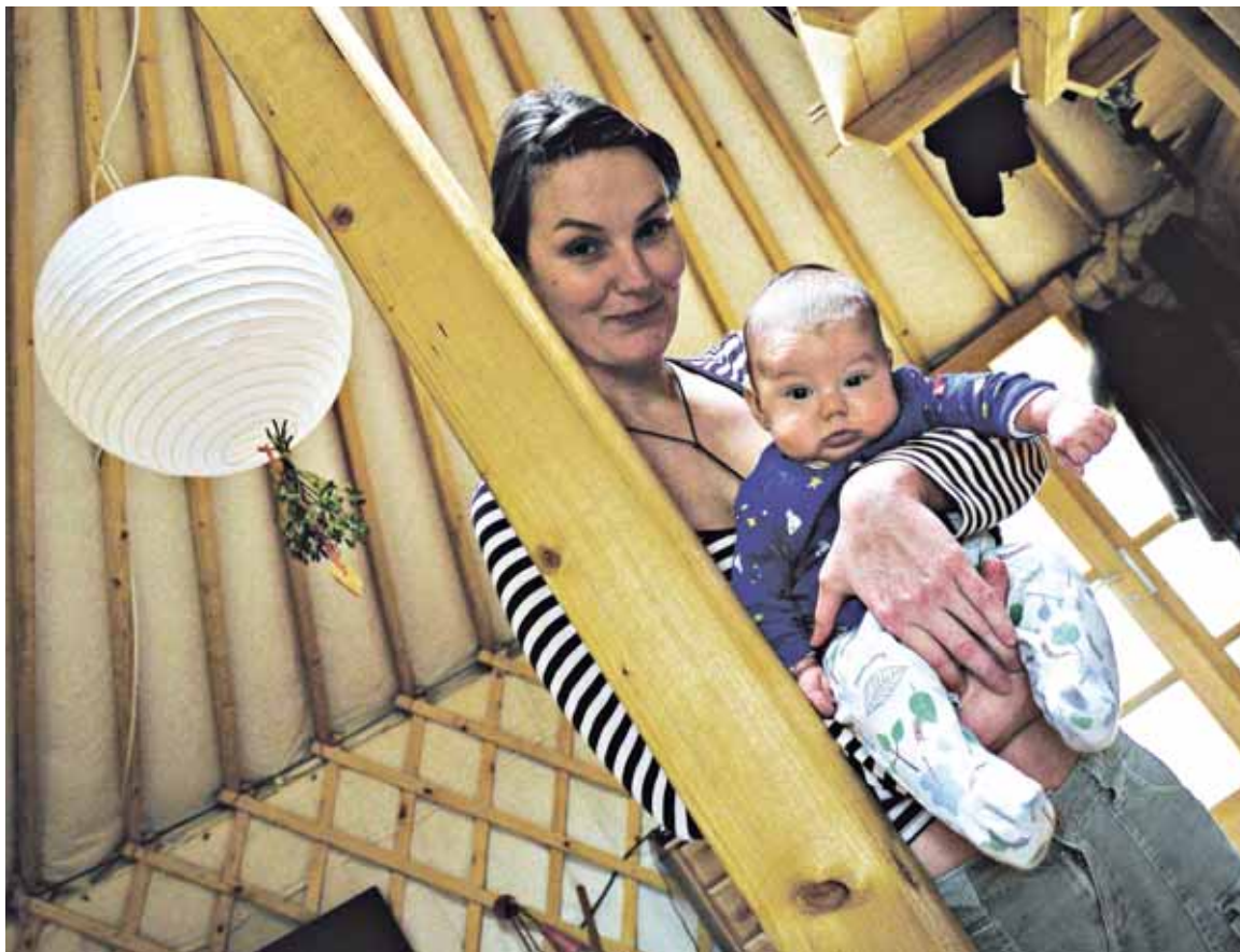
● Zvnútra je to klasická jurta, zvonka zatiaľ nedokončený slamený dom.