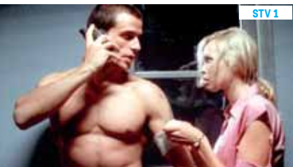
22.45 Minúty strachu