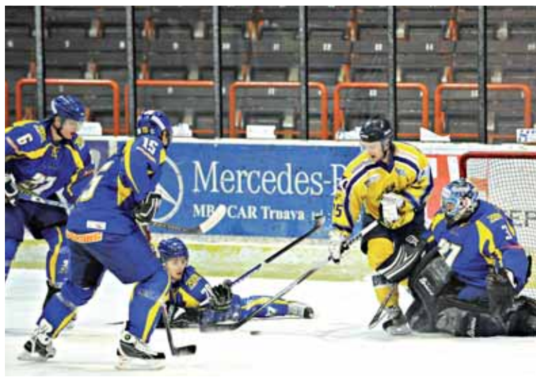
● Ešte v 50. minúte zápasu nevedeli Piešťanci, kam skôr skočiť. Aj tak sa však tešil z bodov líder tabuľky.