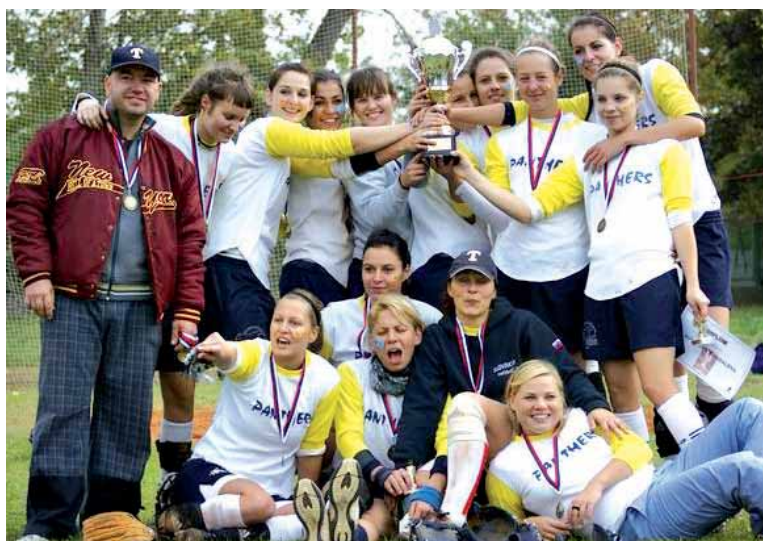
● ... a na jar možno ani tieto dievčatá nebudú mať kde trénovať a hrať.