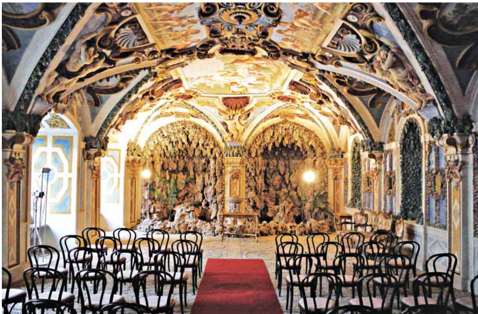
• Salla terena, v ktorej sa panstvo schovávalo pred páliivým slnkom. Z jaskynnej imitácie stekala voda.

Na ruinách strážneho hradu pýcha Malých Karpát