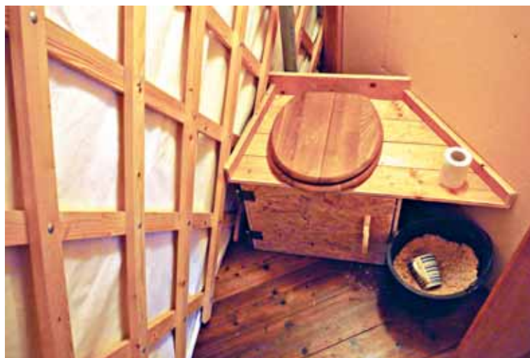
● Suchá, pilinová toaleta nesmrdí a jej obsah je skvelým hnojivom.

Konštrukciu jurty, obstavanej slameným domom, si vymyslel sám.