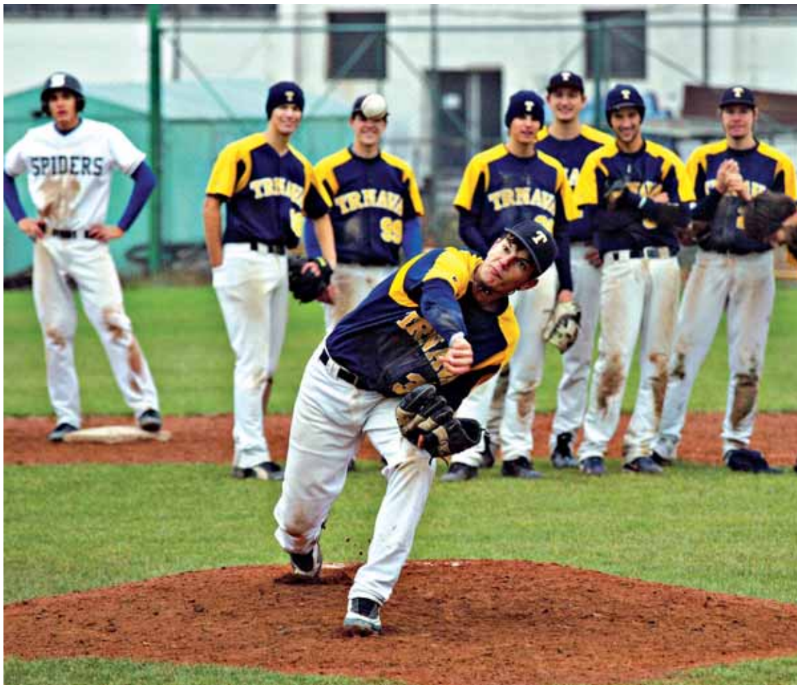
● Trnavskí bejzbalisti získali v roku 2009 tri majstrovské tituly. Zopakujú úspech i tento rok?

Klub plánuje aj organizovanie viacerých turnajov a účasť na zahraničných podujatiach. „Muži sa ako majstri krajiny zúčastnia 14. až 19. júna na kvalifikácii Pohára majstrov v bieloruskom meste Brest,“ povedal šéf trnavského klubu a jedným dychom dodáva ďalšie novinky. „Muži si podali prihlášku do českej federácie, aby sa zúčastnili na Českom pohári. Okrem toho sme požiadali o organizáciu kvalifikácie majstrovstiev Európy juniorov,“ pokračuje. „Chceli by sme