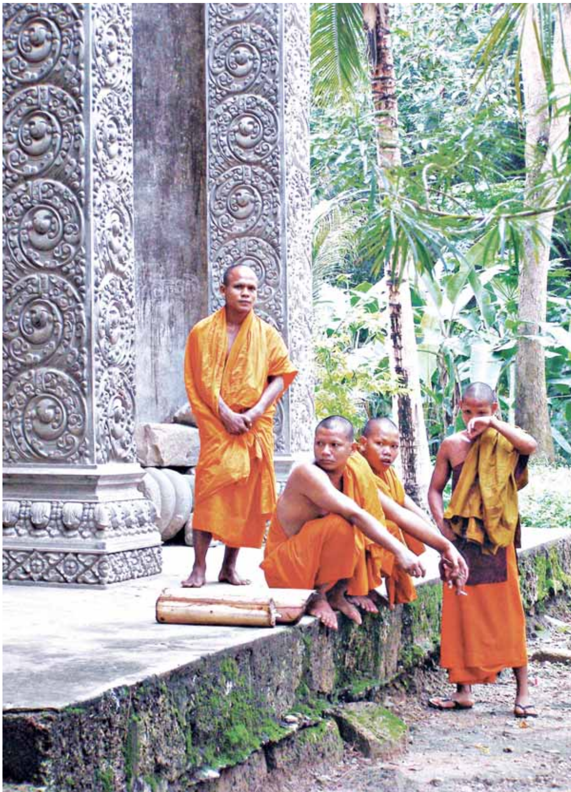
● Exotika. Budhizmus má v Kambodži hlboké korene.