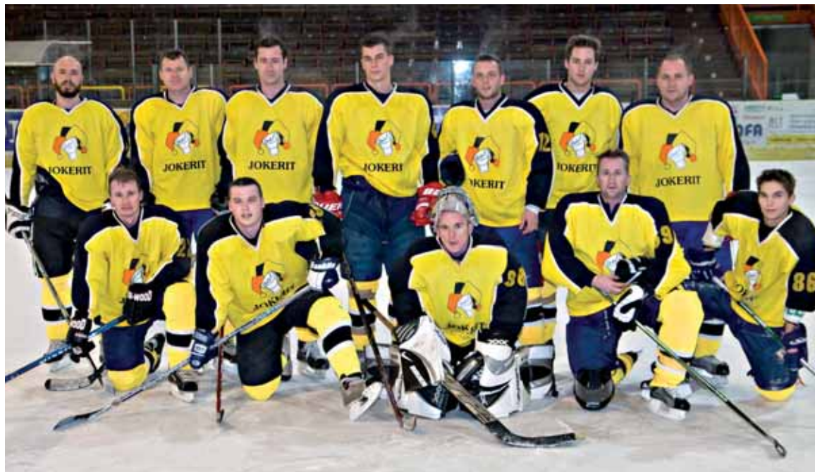
● Jokerit zatiaľ veľký dôvod na úsmev nemá, v interlige mu patrí posledné miesto.