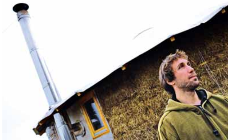
● „Som opatrný. Najnebezpečnejšie miesta musia byť dostatočne chránené, aby sa nič nestalo.”