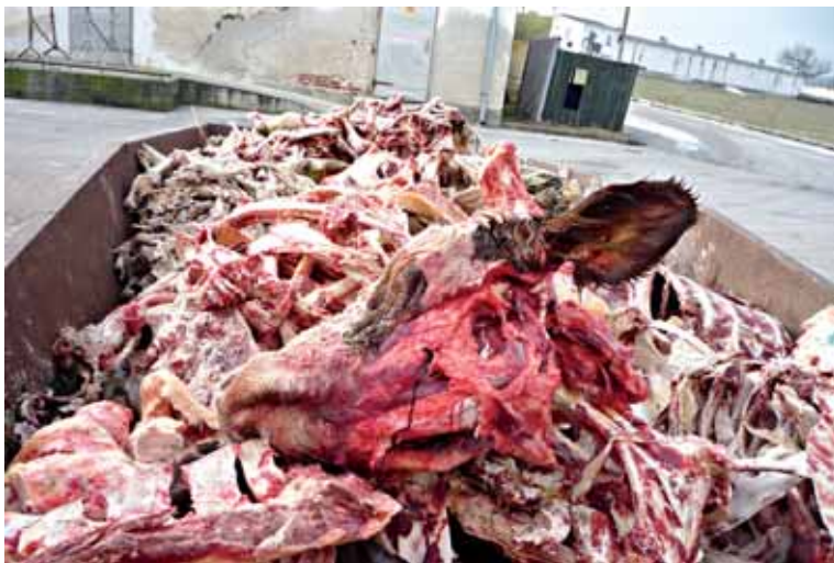
● Likvidáciu odpadových kostí a biologického odpadu preveria inšpektori.

Kde končí odpad z bitúnku, preveria pracovníci Regionálnej veterinárnej a potravinej správy v Piešťanoch. „V tej