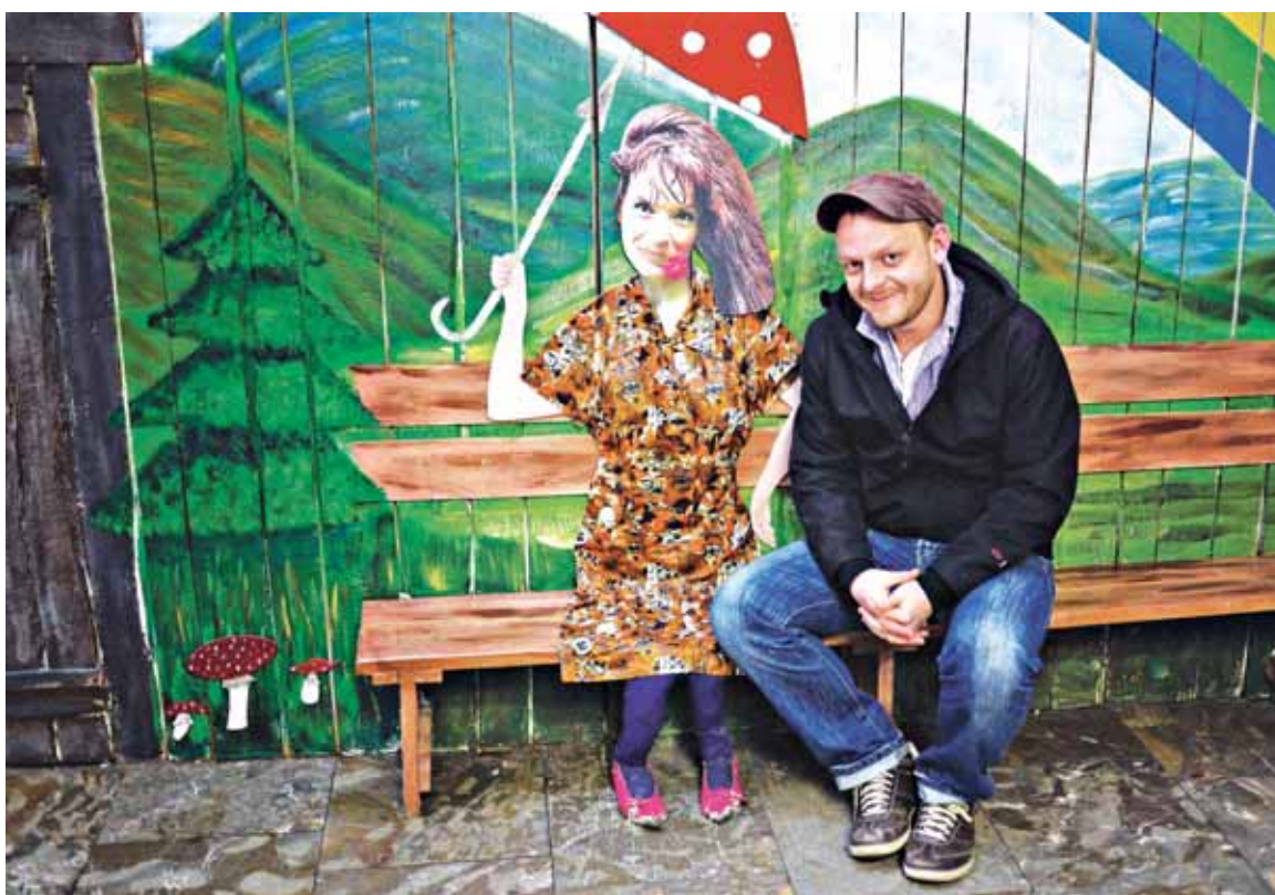
● Muž mnohých tvári. Ďakujeme Radošinskému naivnému divadlu za poskytnutie priestorov na fotografovanie.